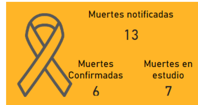
Casos de dengue, con relación al promedio semanal. Norte de Santander. 2024