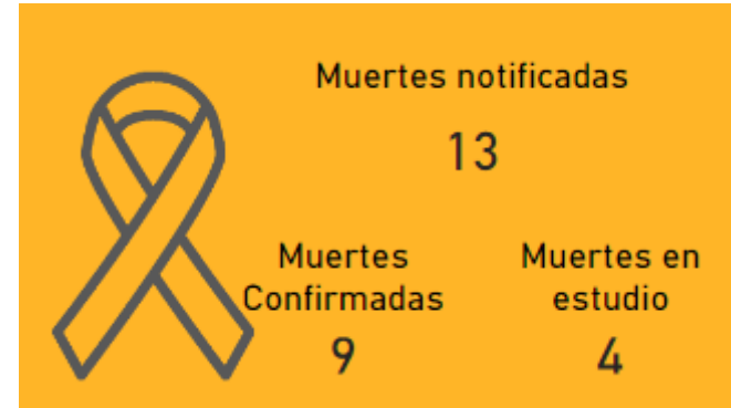
Casos de dengue, con relación al promedio semanal. Norte de Santander. 2024