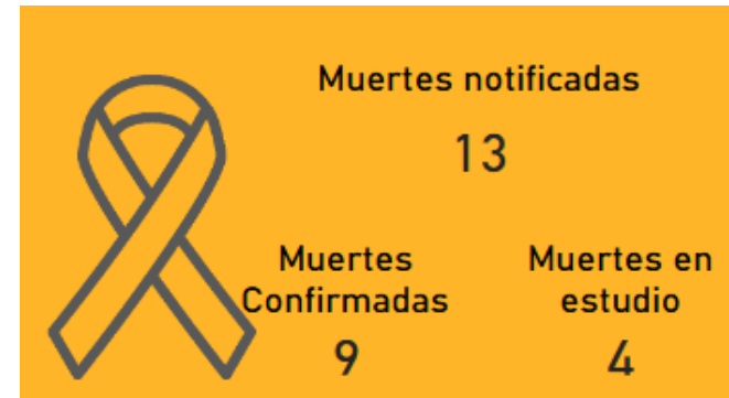
Casos de dengue, con relación al promedio semanal. Norte de Santander. 2024